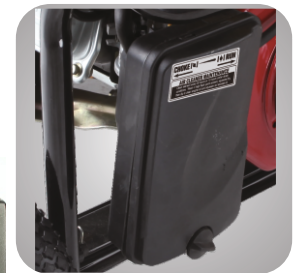
Filtru de aer patentat