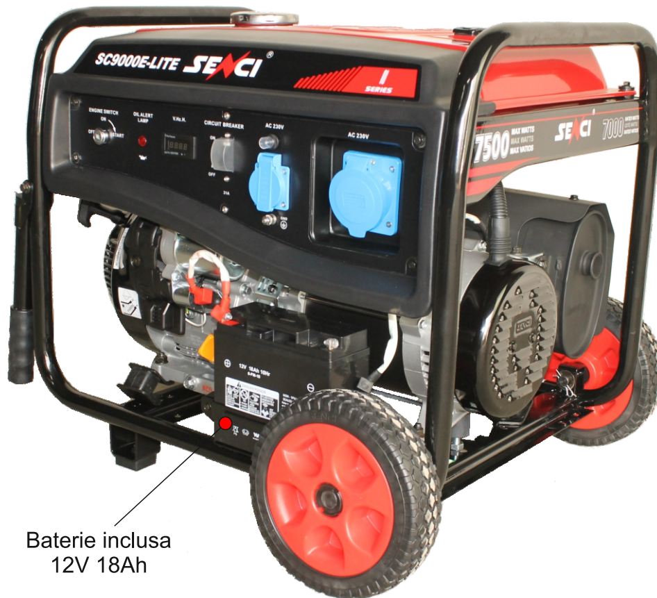
Baterie inclusa 12V 18Ah