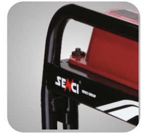
Cadru tratat pentru a preveni ruginirea